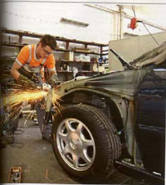
Versicherer müssen für Karosserieschäden bezahlen