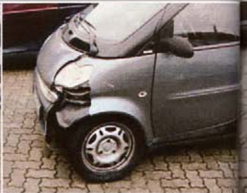
UNFALLWAGEN Der graue Smart ist sichtbar beschädigt. Diese Fotos legte der vom Unfallopfer beauftragte freie Sachverständige seinem unabhängigen